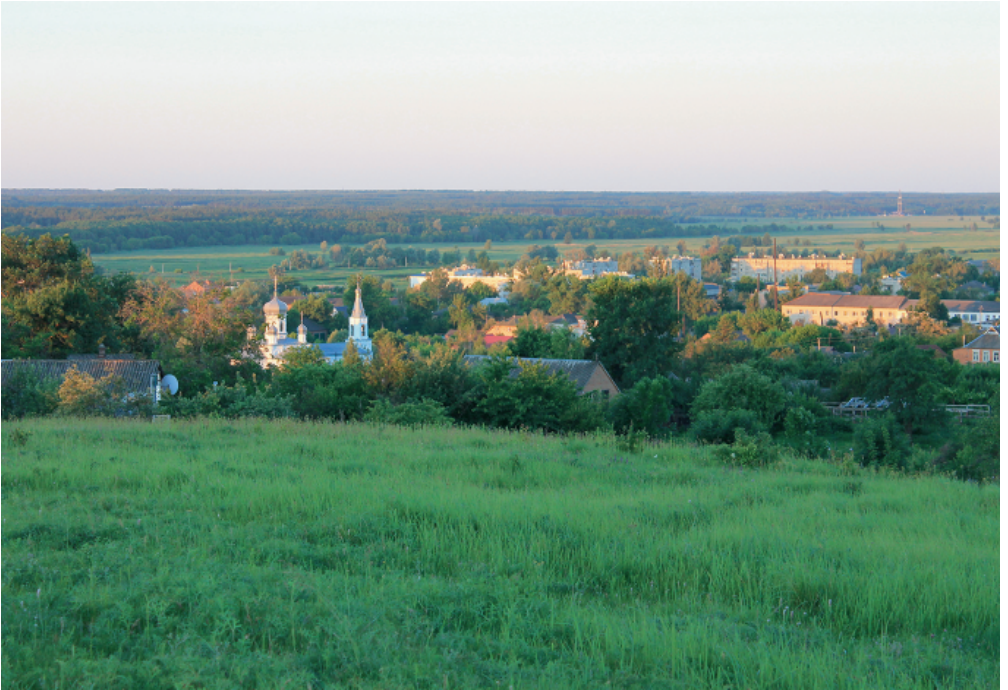
Панорамний вид на Краснокутськ