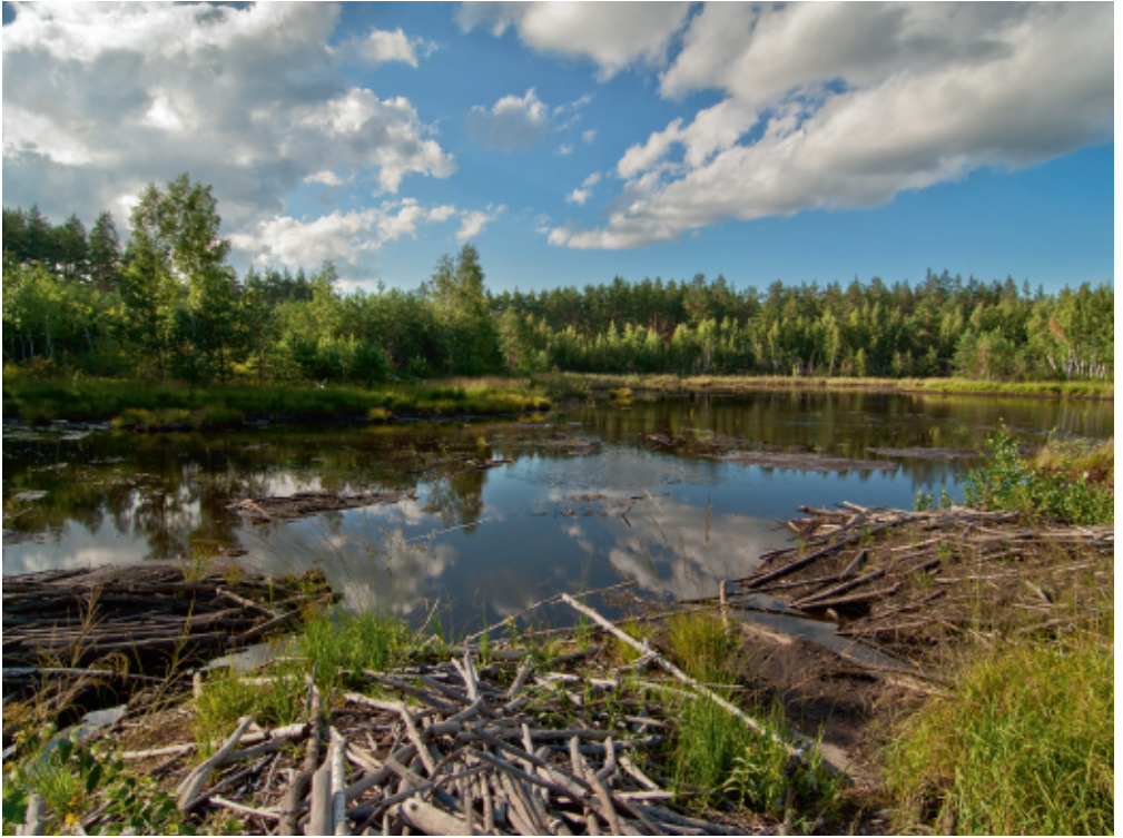
Сліди діяльності бобра європейського у НПП «Слобожанський» С. Рижков