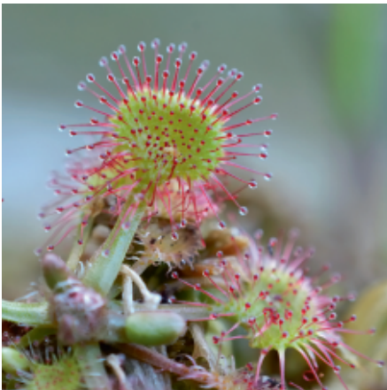
Росичка круглолиста С. Рижков

Національний природний парк «Слобожанський» якнайкраще презентує все багатство лісів краю. Тут знайдемо і нагірні діброви, і заплавні дубово-ясеневі ліси, і заболочені вільхові, соснові та березові ліси, а також повсюдно знайомі насадження сосни. А все тому, що його територія охоплює плато, долину р. Мерла та лівобережжя її притоки. Загалом ландшафти та рослинний світ надзвичайно добре збереглися, зокрема і надзаплавні тераси. Завдячуючи цьому, тут, в лісостепу, трапляються властиві Поліссю рослини – верес, чорниця, а на болотах комахоїдна рослина росичка та диво-ягода журавлина.