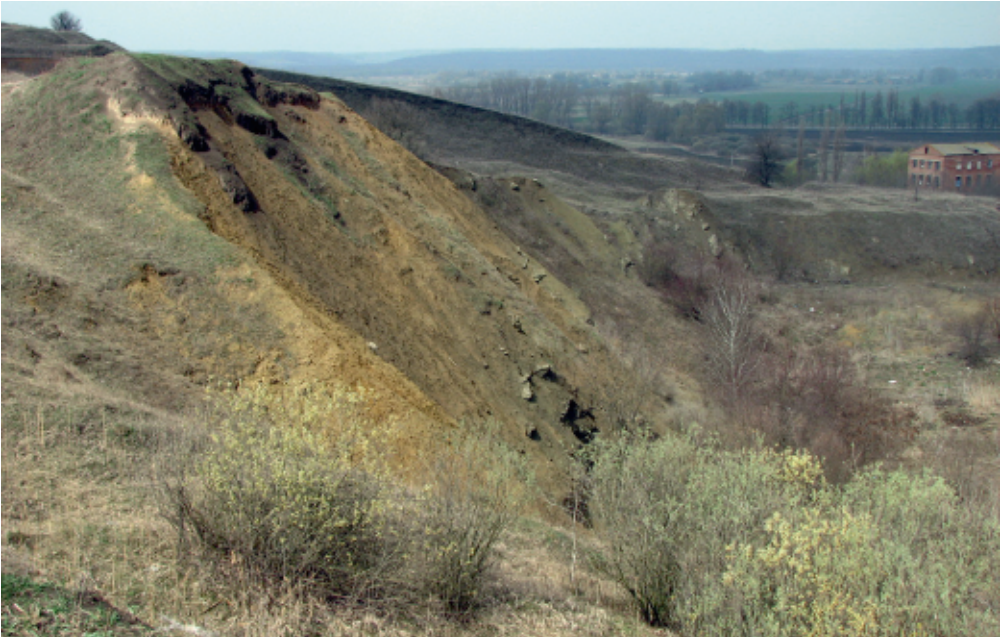
Гора Золотуха неподалік с. Пустовійтівка М. Книш