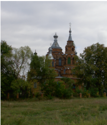
Миколаївська церква у с. Пустовійтівка С. Панченко

Село Пустовійтівка – стоїть на лівому березі р. Сула. Тут народився останній кошовий Запорізької Січі Петро Калнишевський. У селі діє філія історико-культурного заповідника «Посулля». Фахівці заповідника проводять екскурсії до вітряка, дерев'яної Свято-Троїцької та мурованої Миколаївської церков, і, звичайно, в музей Петра Калнишевського з унікальним Євангелієм.