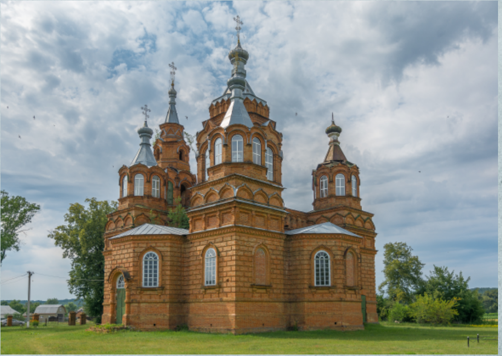
Свято-Троїцька церква, Пустовійтівка