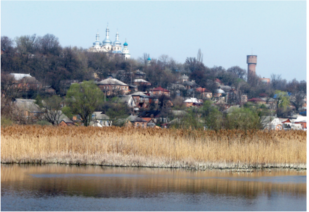
Вид на м. Ромни із-за р. Сула М. Книш