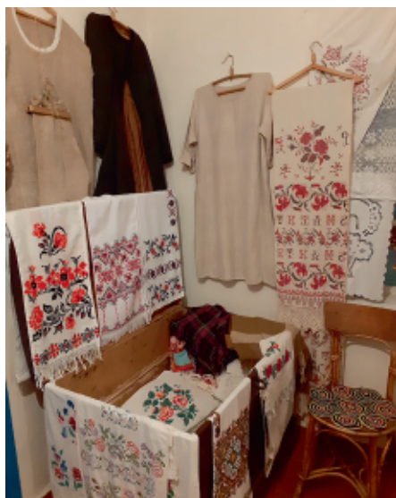
У народному музеї П. Бартош у с. Землянка. С. Моторний

Згадали гетьманів – поруч Глухів, столиця Гетьманщини, куди велосипедом їдемо через Шевченкове прямо манівцями через головний в'їзд крізь Київську браму. Ще завітайте до маєтку Скоропадських у Полошках, де збереглися старовинний парк, а в селі – їхня церква. В Глухові важливо оптимізувати свої плани, адже великий вибір атракцій – краєзнавчий та археологічний музеї, історичний центр. Найкраще замовити екскурсію у НЗ «Глухів», і дізнаєтеся основне про колишню столицю і містечко з найстарішим педагогічним університетом України та Інститутом, де вперше у світі вивели безнаркотичні сорти конопель. Глухівщина стала у XIX ст. одним із центрів індустріалізації, і це якнайкраще відобразилося у місцевій архітектурі. Зворотній шлях до Землянки особливо приємний на заході сонця вниз на сіверське Полісся – «край лісів та імлістих боліт».