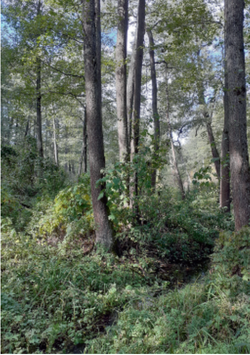
Вільховий ліс у заплаві р. Есмань біля с. Землянка. С. Панченко