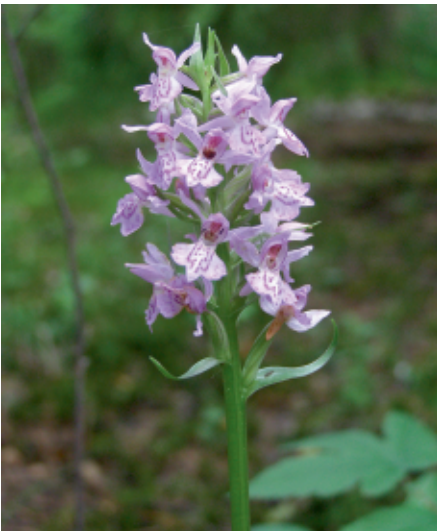
Болотна орхідея пальчатокорінник Фукса С. Панченко

Заказник «Верхньоесманський» (2 912,5 га) – один із найбільших у краї. Його територія охоплює ліси та болота біля витоків р. Есмань – притоки Реті та Десни. Заказник вражає різноманіттям, адже тут збереглися типові поліські соснові ліси зеленомохові та чорницеві, невеличкі ділянки зі світлими дібровами.