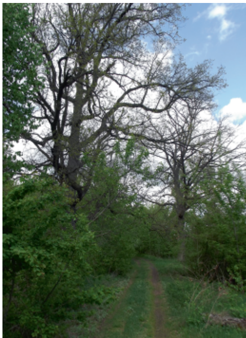
Дуби біля Гамаліївського монастиря С. Панченко