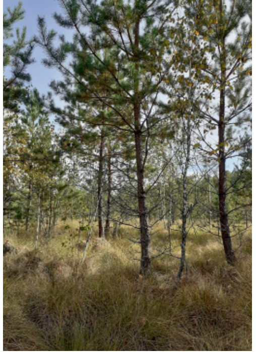
Мохове болото у заказнику «Верхньоесманський». С. Панченко