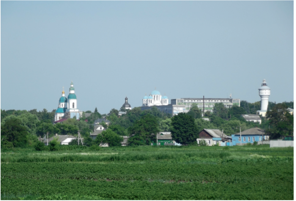
Вид на Глухів із боку Київської брами С. Панченко