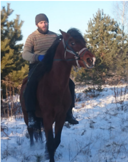
Кінна прогулянка у «Медовому гаю» С. Моторний

Село Землянка стоїть осторонь сучасних шляхів сполучення, межує з лісами і болотами, що увійшли до заказника «Верхньоеманський». У селі створили народний музей Пелагеї Литвинової-Бартош – відомої етнографіні, сформувався туристичний кластер з екосадиб «Медовий гай», «Заповідна борть» та ін. Ентузіасти відтворюють старовинні обрядові традиції та ремесла. Відвідувачам пропонують кінні прогулянки – від верхової їзди до походів на санях узимку та в кибитці влітку. Кожен може скуштувати медових напоїв, сирів, спробувати себе у ткацтві, куховарінні біля печі або в ролі учасника народного обряду.