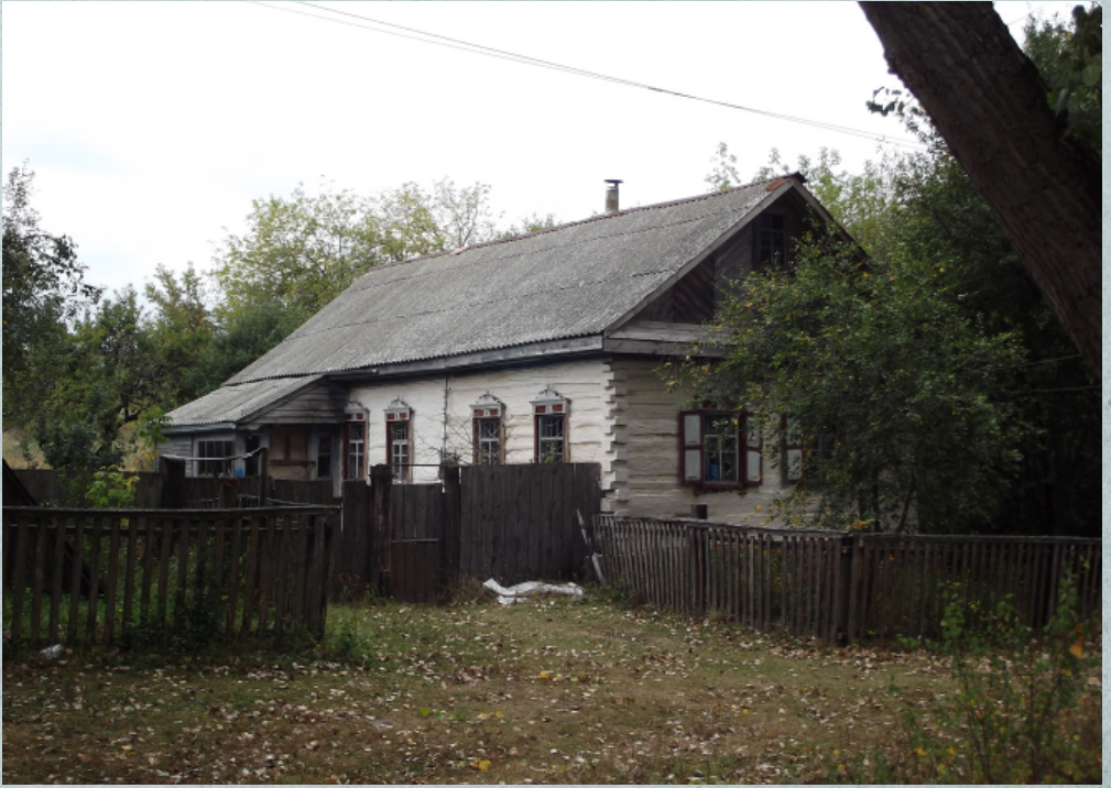
Сільський будинок на околицях Новгорода-Сіверського С. Панченко