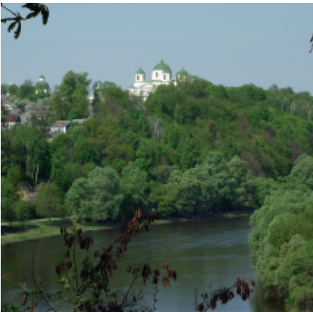
Вид на Спасо–Преображенський монастир. С. Панченко

Місто Новгород–Сіверський розташоване на кручі над Десною. Тисячу років тому центрами цього княжого міста були фортеця на неприступній Замковій горі та пристань – центр торгівлі. Серед численних історичних пам'яток міста сьогодні виділяється комплекс Спасо–Преображенського монастиря–фортеці, Успенський собор і Миколаївська церква, кілька затишних кварталів у центрі, що майже не змінилися із середини та кінця ХІХ ст.