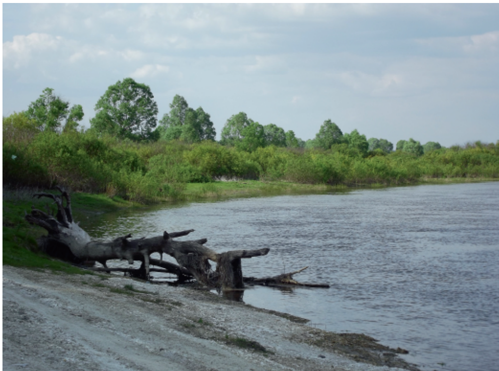
Крейдяний берег Десни біля с. Пушкарі. С. Панченко