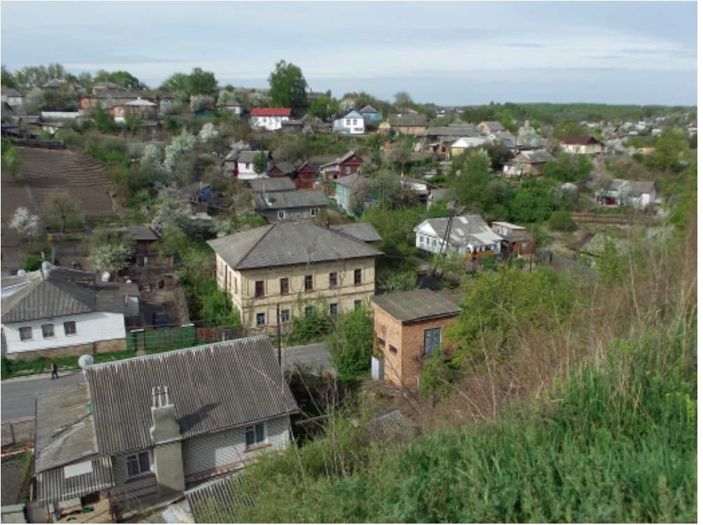
Вид на Новгород–Сіверський із Замкової гори. С. Панченко