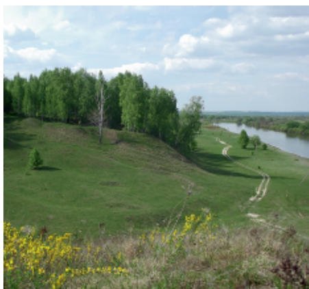
Крутосхили правого берега Десни біля с. Рогівка. С. Панченко